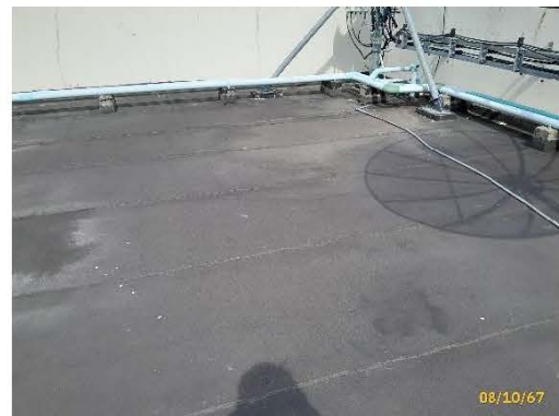
ภาพที่ 2.2-3 แผ่นกันความร้อนบริเวณหลังคา