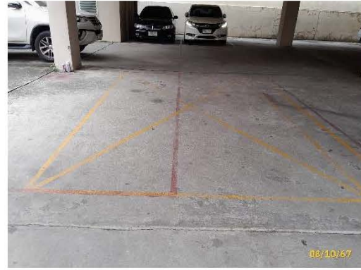
ภาพที่ 2.2-1 พื้นที่จอดรถ และทางสัญจร