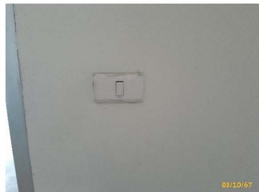
ภาพที่ 2.2-4 จุดเปิด-ปิดไฟส่วนกลาง