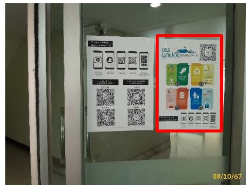
ภาพที่ 2.2-6 การรณรงค์คัดแยกมูลฝอย