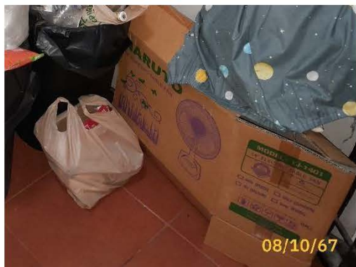
ภาพที่ 2.2-7 ขยะมูลฝอยรีไซเคิลที่มีการคัดแยก