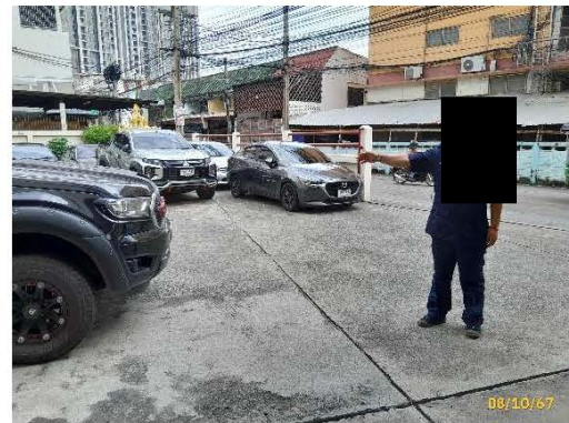
ภาพที่ 2.2-2 เจ้าหน้าที่รักษาความปลอดภัยขณะอำนวยความสะดวกด้านการจราจร