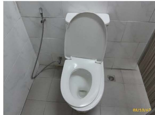
ภาพที่ 2.2-10 ห้องน้ำ-ห้องส้วม