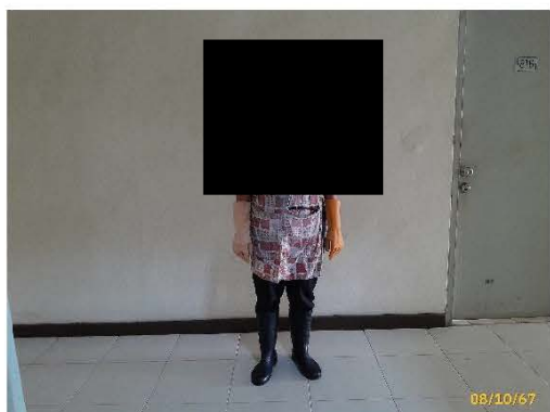
ภาพที่ 2.2-9 อุปกรณ์ป้องกันสำหรับผู้ปฏิบัติหน้าที่ในการเก็บขนมูลฝอย