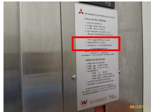
ภาพที่ 2.2-14 ป้าย “ห้ามใช้ลิฟท์ขณะเพลิงไหม้”