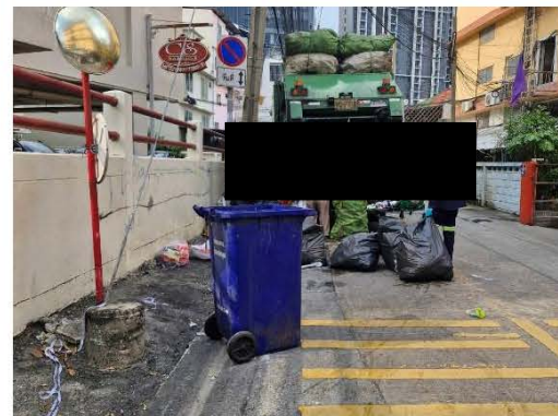
ภาพที่ 2.2-15 การเก็บมูลฝอยของสำนักงานเขต