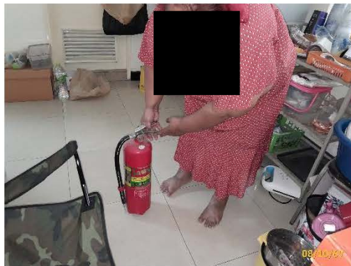
ภาพที่ 2.2-13 การตรวจสอบระบบดับเพลิง