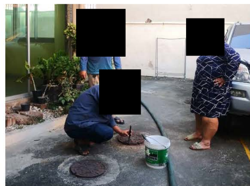
ภาพที่ 2.2-11 การสูบน้ำก่อนระบบบำบัดน้ำเสีย